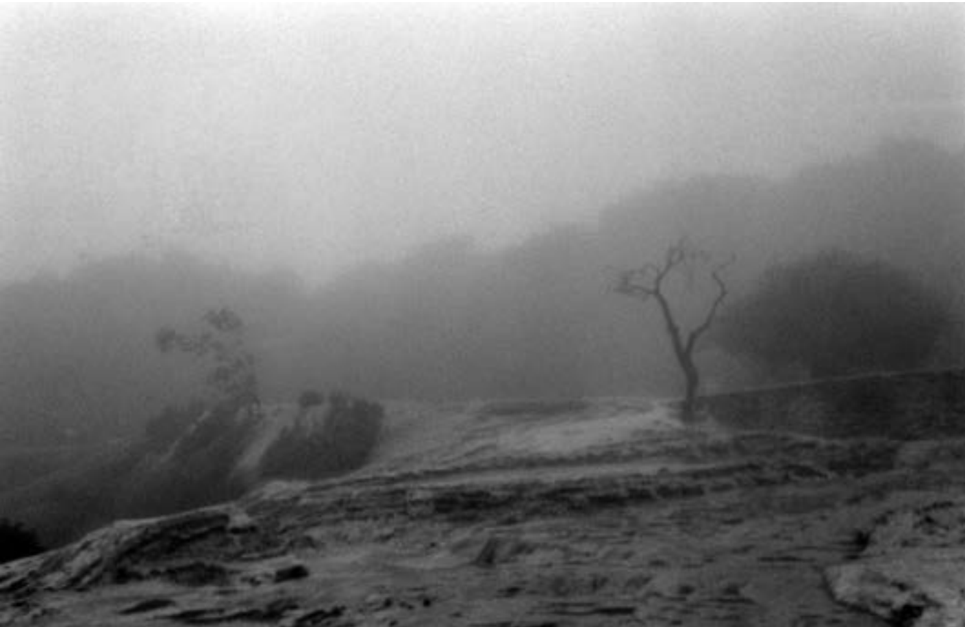
De la serie "Hierve el agua" Oaxaca Año 2010 Fotografía Gelatina de plata sobre papel baritado 24 x 37,5 cm Edición 15 + A/P