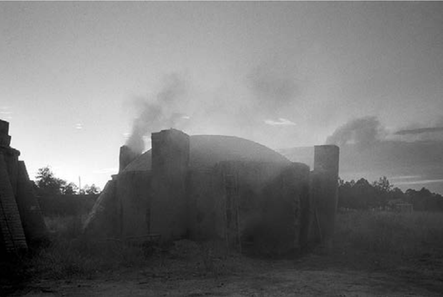
De la serie "México" Fábrica de carbón, Durango día 2 Año 2010 Fotografía Gelatina de plata sobre papel baritado 24 x 37,5 cm Edición 15 + A/P