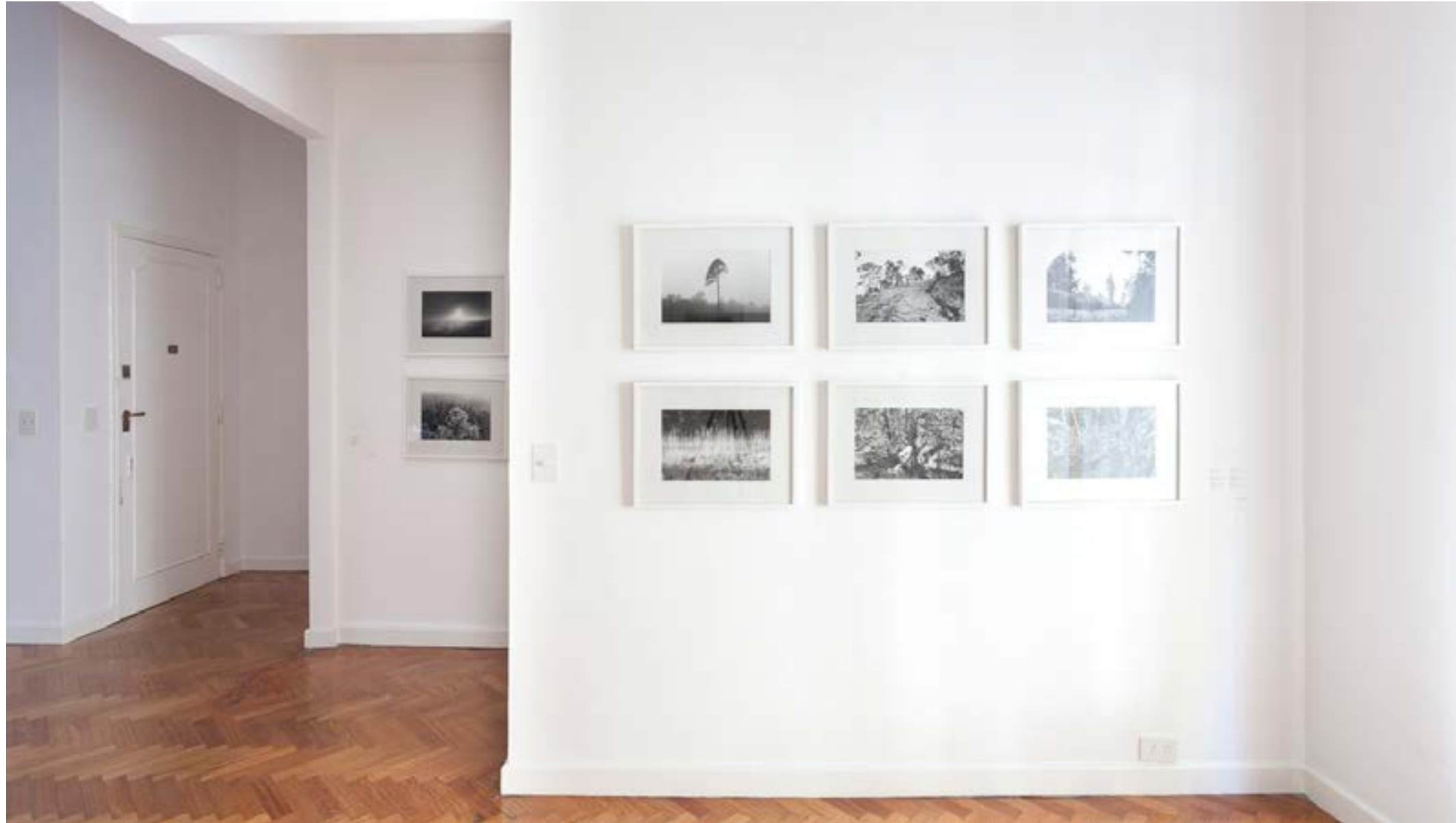
México Rolf Art, Buenos Aires, Argentina Vista de sala