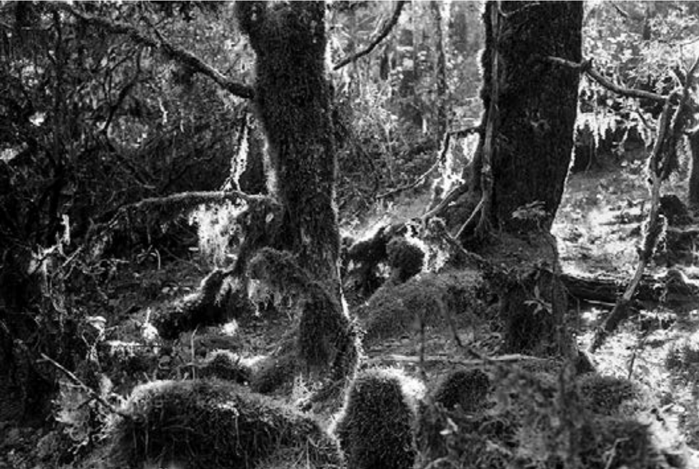
De la serie "México" Comaltepec, Oaxaca día 7 Año 2010 Fotografía Gelatina de plata sobre papel baritado 24 x 37,5 cm Edición 15 + A/P