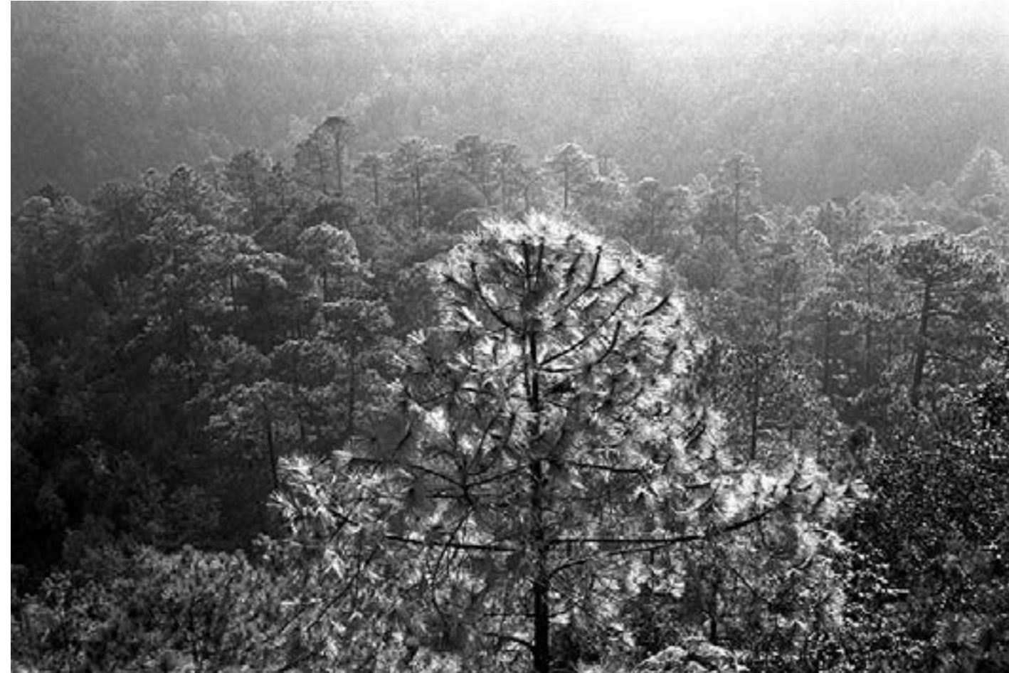
De la serie "México" Molinillo, Durango día 2 Año 2010 Fotografía Gelatina de plata sobre papel baritado 24 x 37,5 cm Edición 15 + A/P