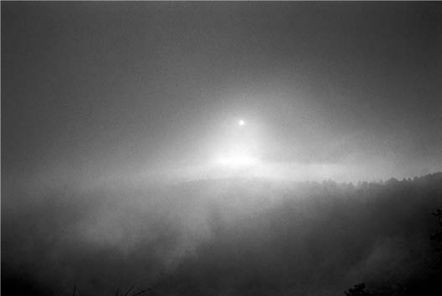
De la serie "México" Molinillo, Durango día 2 Año 2010 Fotografía Gelatina de plata sobre papel baritado 24 x 37,5 cm Edición 15 + A/P