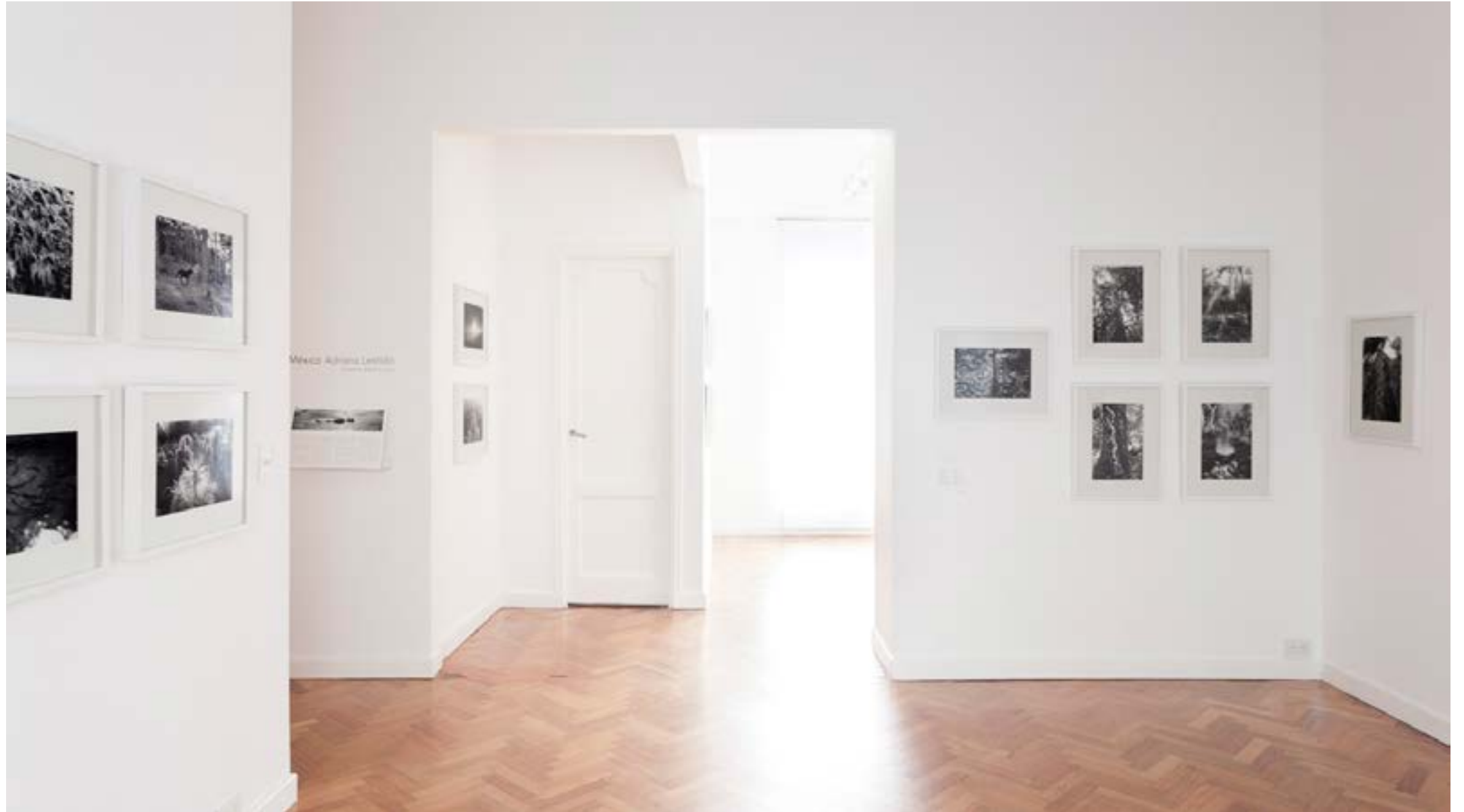
México Rolf Art, Buenos Aires, Argentina Vista de sala