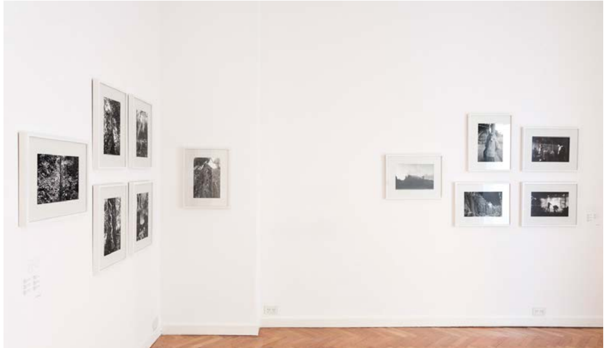
México Rolf Art, Buenos Aires, Argentina Vista de sala