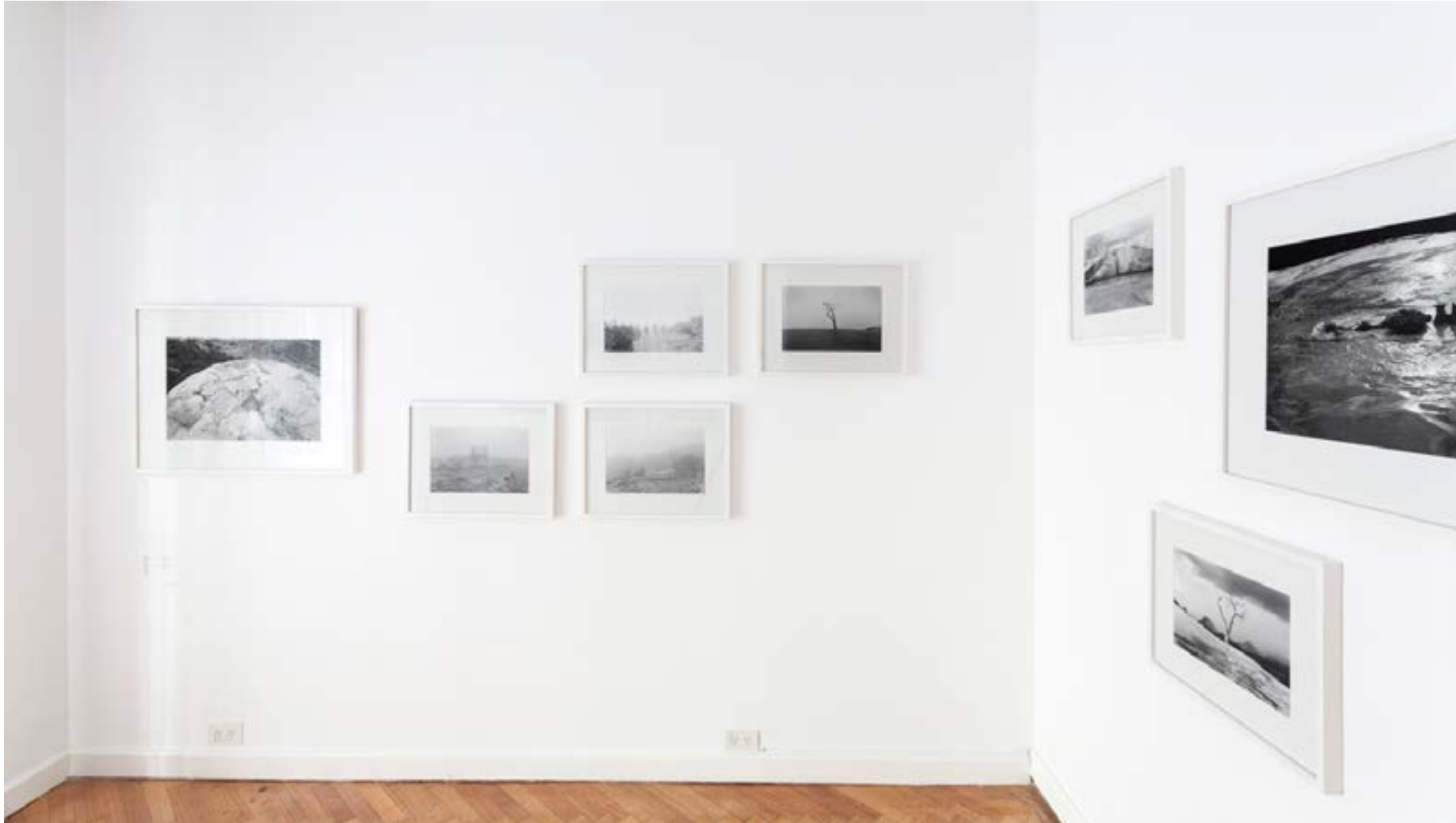
Hierve el agua Rolf Art, Buenos Aires, Argentina Vista de sala