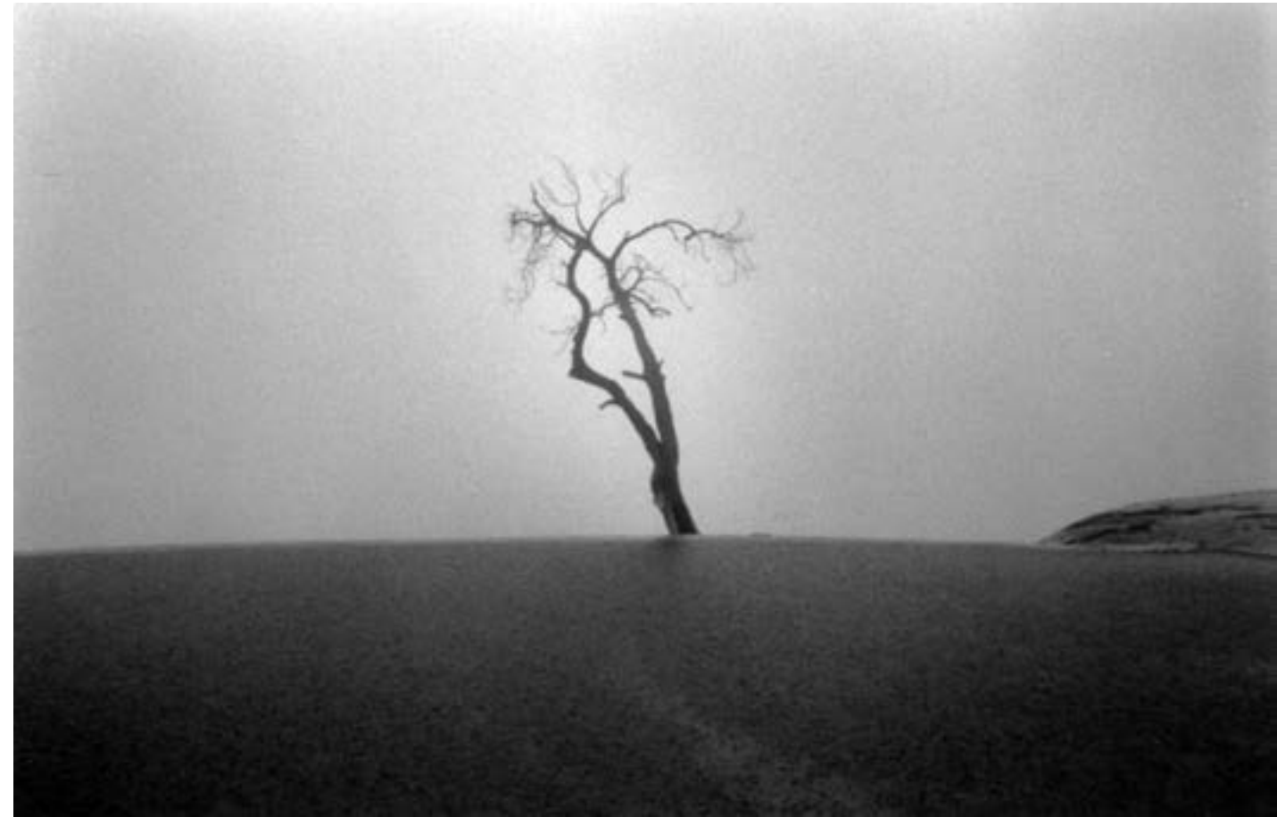
De la serie "Hierve el agua" Oaxaca Año 2010 Fotografía Gelatina de plata sobre papel baritado 24 x 37,5 cm Edición 15 + A/P