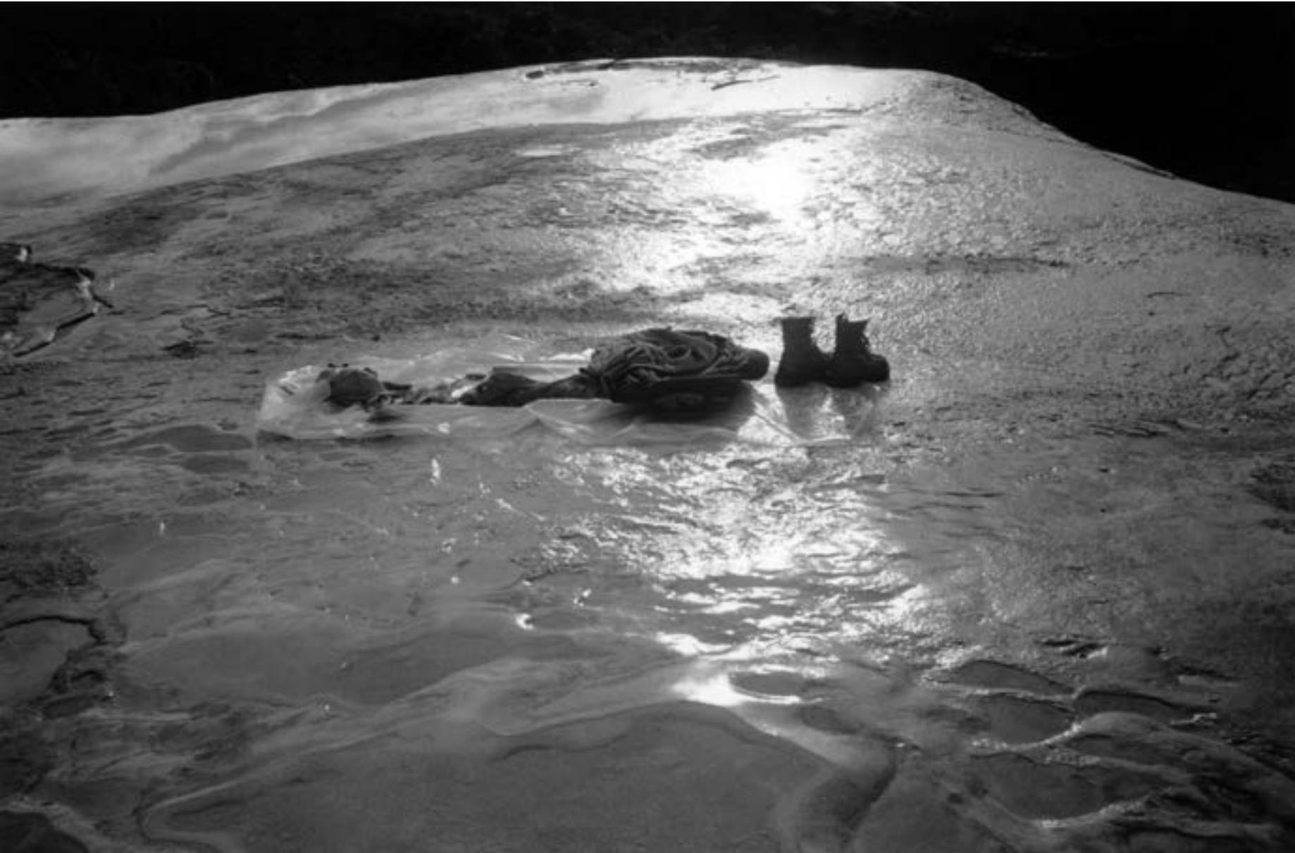
De la serie "Hierve el agua" Oaxaca Año 2010 Fotografía Gelatina de plata sobre papel baritado 38,5 x 58 cm Edición 15 + A/P