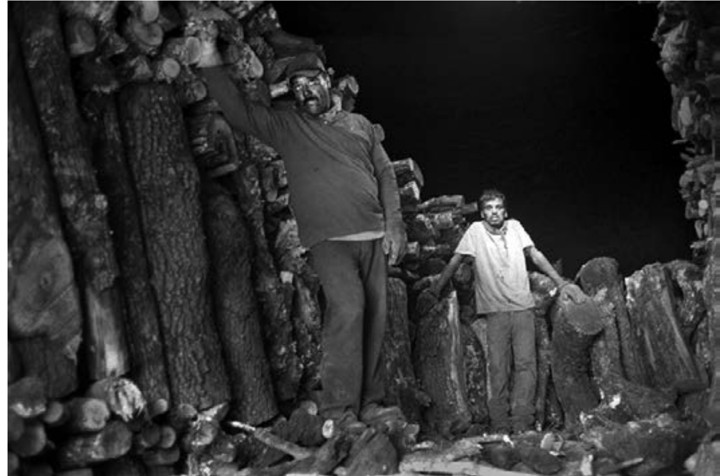
De la serie "México" Fábrica de carbón, Durango día 2 Año 2010 Fotografía Gelatina de plata sobre papel baritado 24 x 37,5 cm Edición 15 + A/P