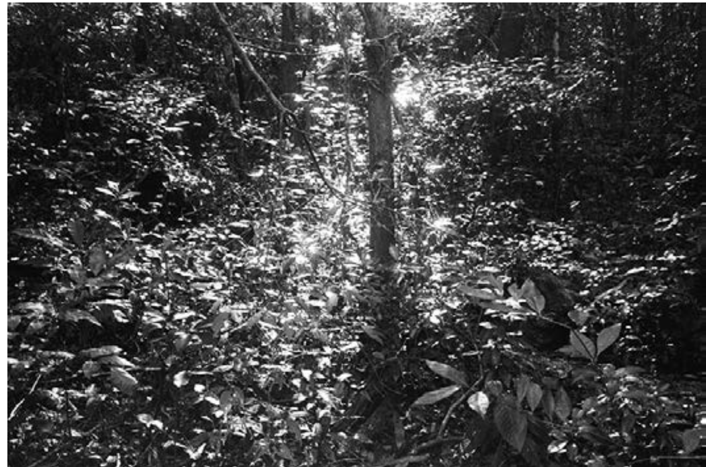
De la serie "México" San Antonio Puk, Quintana Roo día 4 Año 2010 Fotografía Gelatina de plata sobre papel baritado 24 x 37,5 cm Edición 15 + A/P