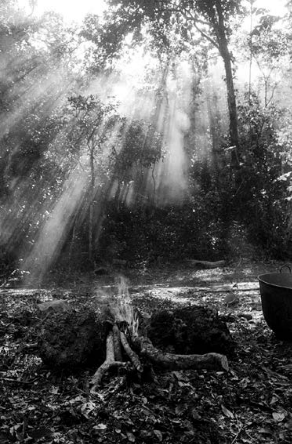
De la serie “México” San Antonio Puk, Quintana Roo día 4 Año 2010 Fotografía Gelatina de plata sobre papel baritado 37,5 x 24 cm Edición 15 + A/P