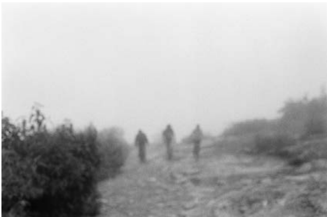
De la serie " Hierve el agua " Oaxaca Año 2010 Fotografía Gelatina de plata sobre papel baritado 24 x 37,5 cm Edición 15 + A/P