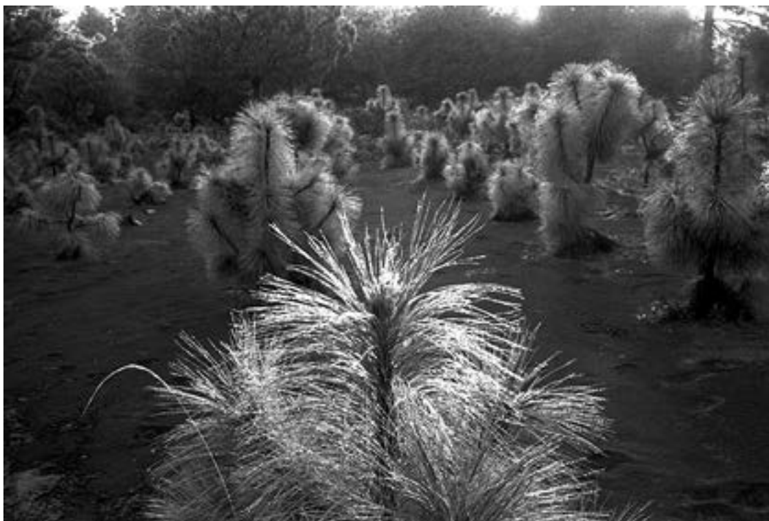
De la serie “México” Comaltepec, Oaxaca día 8 Año 2010 Fotografía Gelatina de plata sobre papel baritado 24 x 37,5 cm Edición 15 + A/P