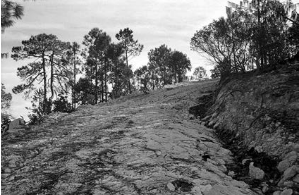
De la serie “México” Molinillo, Durango día 2 Año 2010 Fotografía Gelatina de plata sobre papel baritado 24 x 37,5 cm Edición 15 + A/P