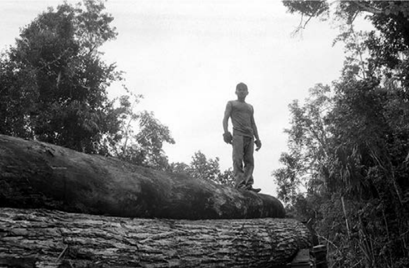
De la serie "México" Nob-Hec, Quintana Roo día 4 Año 2010 Fotografía Gelatina de plata sobre papel baritado 24 x 37,5 cm Edición 15 + A/P