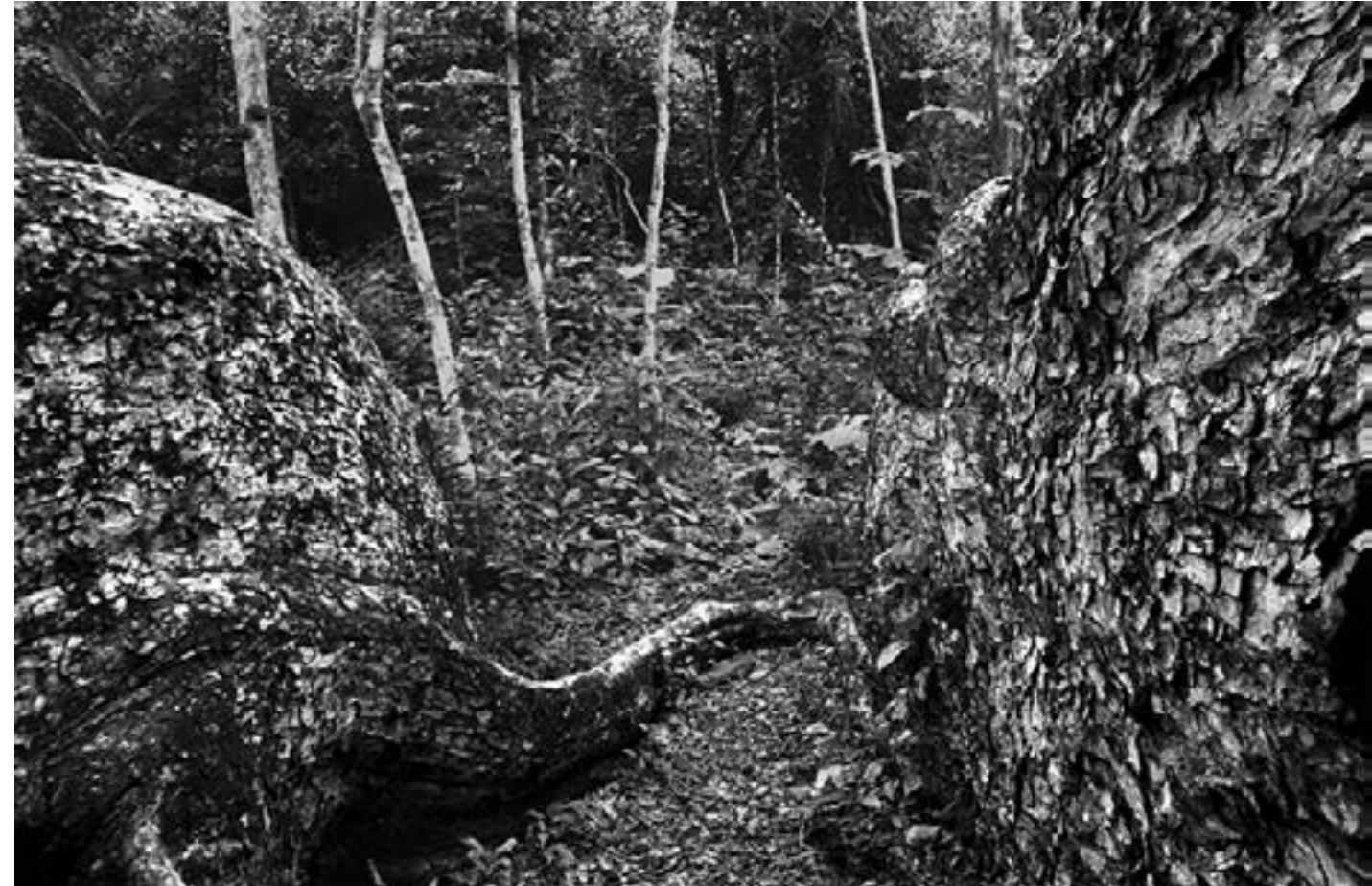
De la serie "México" Nob-Hec, Quintana Roo día 4 Año 2010 Fotografía Gelatina de plata sobre papel baritado 24 x 37,5 cm Edición 15 + A/P