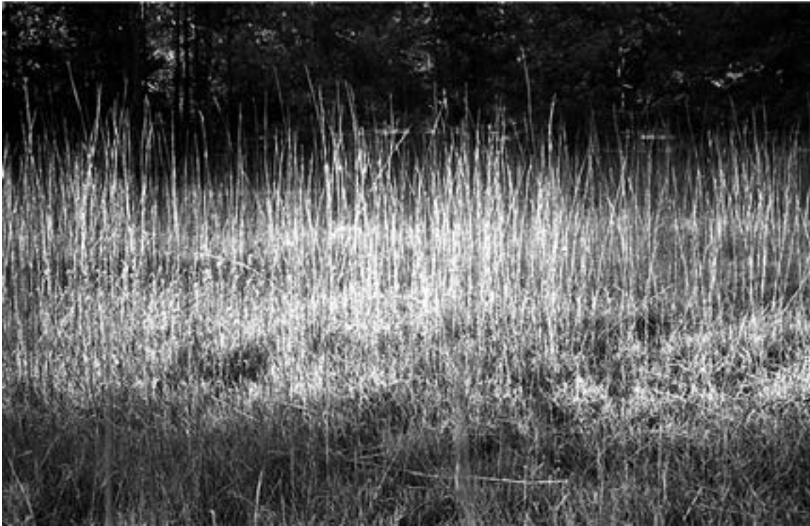
De la serie “México” Devisadero, Durango día 1 Año 2010 Fotografía Gelatina de plata sobre papel baritado 24 x 37,5 cm Edición 15 + A/P