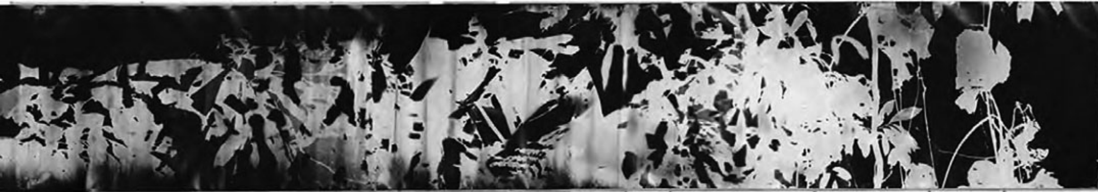
Roberto Huarcaya De la serie | From the series AMAZOGRAMAS #2 Año | Year 2014 Fotografía | Photography Fotograma sobre papel fotosensible | Photogram over photosensitive paper Dimensiones 3000 x 106 cm. | Dimensiones 393,7 x 41,7 in. Pieza única | Unique piece (Detalle | Detail)